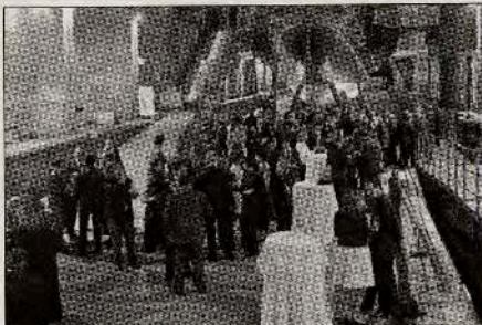
Más de 200 transitarios asistieron al acto / Foto: VM

de los buques requiere un mayor esfuerzo para mejorar las infraestructuras y necesita de un consenso político que permita a los puertos estar a la altura de la demanda. Aludió también a la necesidad de reforzar los enlaces entre el aeropuerto y el puerto y destacó las mejoras que se están realizando en la estiba, el short sea shipping, rutas comerciales, etc.