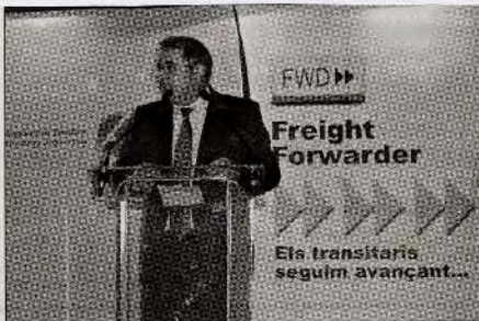
El presidente de la APB clausuró el acto