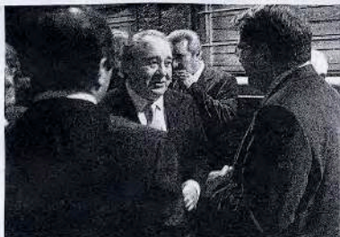
Nadal y Valls en la Nit dels Transitaris