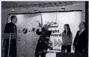
En la Nit se celebró un sirqui con tres ganadores