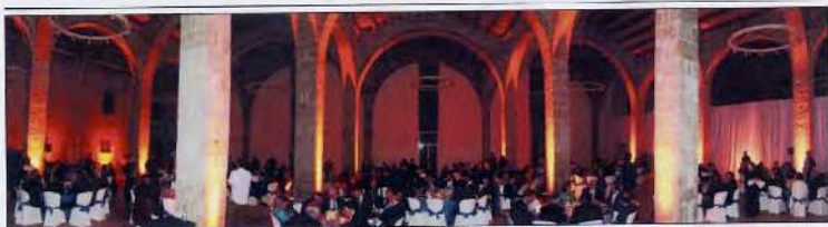
El sector transitario se congregó en el Museu Marítim de Barcelona